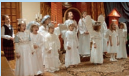
Jasełka 2006 r.