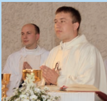
Ks. Prezes i ks. Prefekt

Wspólne Msze Święte (rozpoczęcie roku szkolnego, pierwsze piątki miesiąca, ważniejsze święta i uroczystości kościelne, zakończenie roku szkolnego) – we mszach uczestniczą uczniowie, wszyscy nauczyciele uczący w naszej szkole i rodzice, którym obowiązki służbowe na to pozwolą.