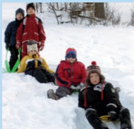
Zimowisko w Zawoi 2006 r.