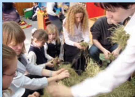
Wspólne zajęcia klasy III Gim i klasy 0, grudzień 2006 r.

Rekolekcje w Kazimierzu Biskupim – uczniowie klasy III gim. przygotowują się do przyjęcia Sakramentu