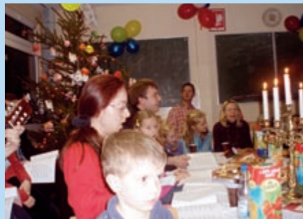
Rodzinne Kolędowanie 2007 r.

Rodzinne Kolędowanie – spotkanie rodzin „szkolnych” i nauczycieli na wspólnym śpiewaniu kolęd. Co roku uczymy się kilku nowych kolęd lub pastorałek. Akompaniują ks. Prefekt i rodzice na gitarach, dzieci na fletach, grzechotkach, kołatkach itp.