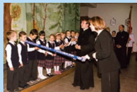
Ślubowanie klasy 1 – mianowanie na ucznia ZSK im. Św. Rodziny

„W szkole rozpoczyna się proces powstania osoby, osobnego człowieka, niezależnego, decydującego o sobie. Powinniśmy zapewnić naszym dzieciom środowisko pełne wolności, bezpieczeństwa i akceptacji. Te elementy tworzą dobro najwyższe – miłość. Miłość w rodzinie, a potem miłość przyjaciół – tworzy Kościół. A szkoła to taka mała część, jedna z cegiełek tej budowy.” A.N.