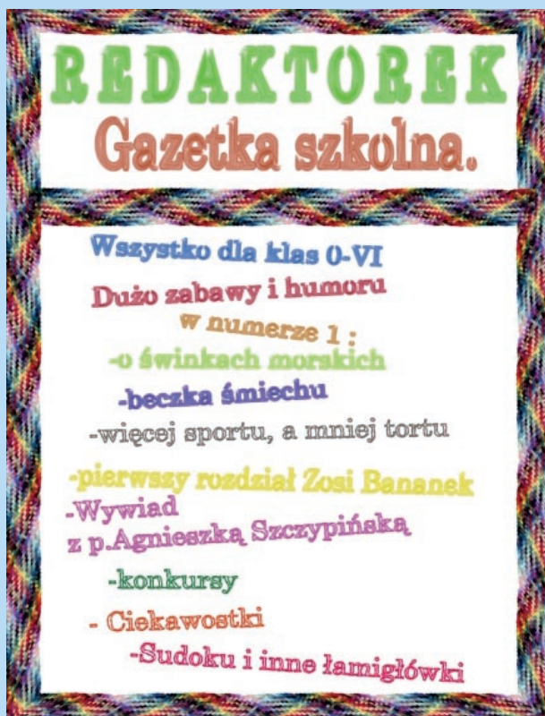
Gazetka szkolna tworzona przez klasy IV-VI