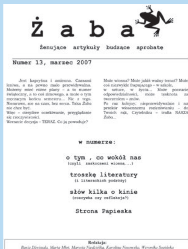
Gazetka szkolna tworzona przez klasę II gimnazjum