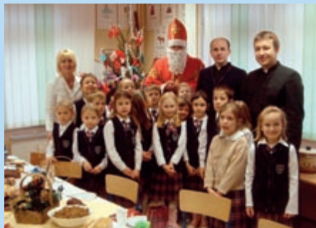
Spotkanie opłatkowe w klasie I

Adwentowy Dzień Skupienia – dzieci przygotowują się do Świąt Bożego Narodzenia przez cały Adwent. Dzień Skupienia jest podsumowaniem tych przygotowań. Dzieci przygotowują prace plastyczne, bądź scenki teatralne, oglądają film związany z tematem Bożego Narodzenia.