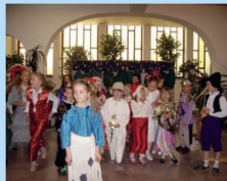
Jasełka 2006 r.

Przegląd Jasełek organizowany przez Otwockie Centrum Kultury