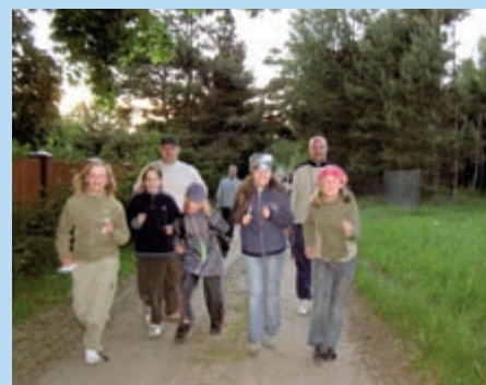
Wyjazd ojców z dziećmi klasy 5 SP, czerwiec 2006 r.

Rekolekcje prowadzą klerycy ze Zgromadzenia. Młodzież jedzie tam z wychowawcą i ks. Prefektem