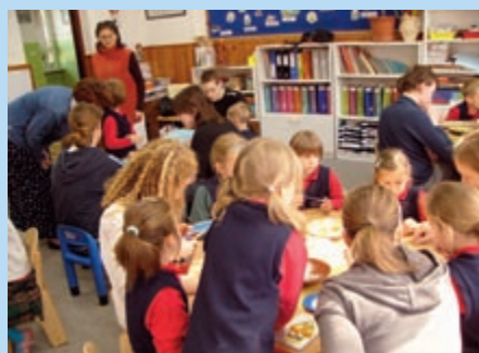
Wspólne zajęcia klasy III Gim i klasy 0, maj 2007 r.

Bierzmowania na rekolekcjach w Kazimierzu Biskupim – ośrodku, w którym mieści się Wyższe Seminarium Duchowne Misjonarzy Świętej Rodziny.