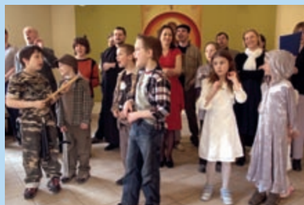
Nasz Teatr Rodzinny „eNTeR” – próba