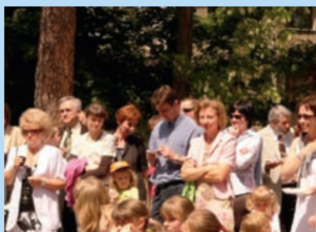
Święto Szkoły – Piknik Rodzinny 2006 r.

Pielgrzymka klasy III gim. do Wilna – na zakończenie Gimnazjum uczniowie