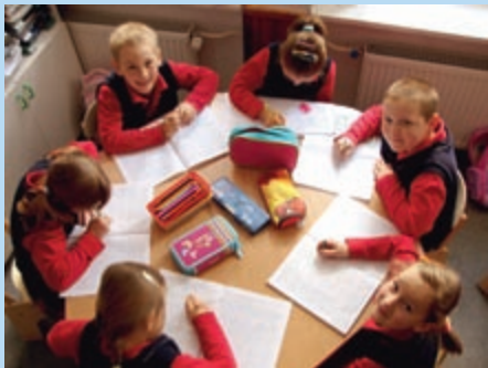
klasa 0 na lekcji

wychowawcom, w wypełnianiu ich zadań. Efekty integralnego rozwoju uzyskamy tylko wtedy, gdy nauczyciele będą nauczać wg. najwyższych standardów i zdobyczy współczesnej nauki i pedagogiki, ale jednocześnie wychowywać w zgodzie z systemem wartości moralnych i religijnych uznawanym przez rodziców. Zajęcia powinny być prowadzone w zgodzie z zasadami wiary katolickiej i w poszanowaniu wolności sumień." R.N.