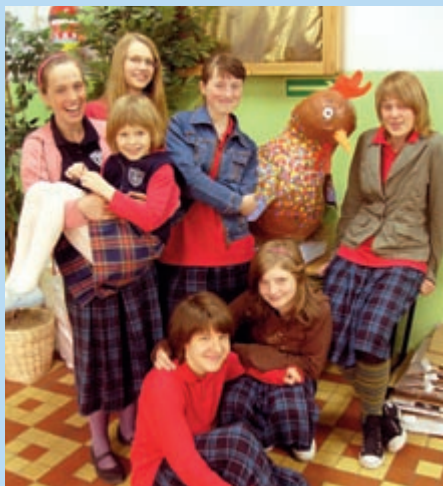
Koło plastyczne gimnazjum oraz ich praca, która zdobyła I miejsce w XVI Konkursie Wielkanocnym

Konkurs języka polskiego organizowany przez Kuratorium Oświaty w Warszawie – wzięli udział uczniowie klas 5 i 6 pod opieką pani Małgorzaty Zagórskiej.