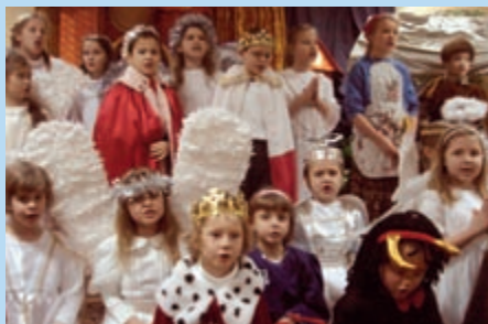
Jasełka 2006 r.