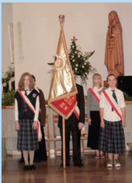
Poczet sztandarowy Zespołu Szkół Katolickich im. Św. Rodziny

„Nasza szkoła oparta jest na wspólnym wysiłku i trudzie. Wspólny wysiłek rodziców, nauczycieli i osób duchownych daje poczucie uczestnictwa oraz uznania za własną drogi, którą wspólnie zmierzamy śladami Świętej Rodziny.” R.N.