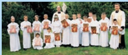
klasa 2 SP – I Komunia Święta 2007 r.

Agapy w klasach – w ostatni dzień rekolekcji i jednocześnie ostatni dzień Szkoły przed Świętami Zmartwychwstania Pańskiego, uczniowie, nauczyciele i rodzice spotykają się na Mszy Świętej. Potem w salach lekcyjnych, poszczególne klasy, spotykają się na wspólnie przygotowanym poczęstunku.