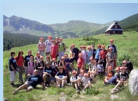
Kolonie letnie Zakopane 2006 r.

Kolonie letnie – o ile jest zainteresowanie rodzin, Szkoła proponuje wyjazd wakacyjny pod opie-