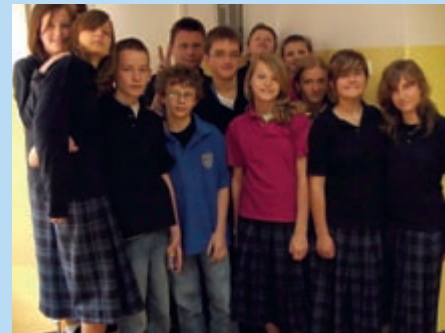
Klasa I Gimnazjum

„Wzajemne relacje organów szkoły: Fundacja „Posłaniec” (organ prowadzący), Dyrektor Szkoły, Rada Szkoły, Rada Pedagogiczna są sprawdzającą się formułą opartą na fundamencie wartości podstawowych, uznanego celu oraz wzajemnym zaufaniu. Bez tych cech szkoła katolicka nie może dobrze funkcjonować. Ze swej istoty wybór takiej