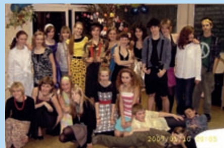
Bal Karnawałowy 2007 r.

Bal karnawałowy – bal przebierańców. Najczęściej ustalony jest temat przewodni balu. W tym roku dzieci młodsze (klasy 0–4) przebierały się wg. motywu „4 pory roku”, dzieci starsze „Lata 60-te”.