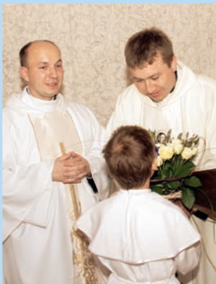
Prezes Fundacji „Postaniec” i Prefekt szkoły

„Nasza szkoła oparta jest na wspólnym wysiłku i trudzie. Wspólny wysiłek rodziców, nauczycieli i osób duchownych daje poczucie uczestnictwa oraz uznania za własną drogi, którą wspólnie zmierzamy śladami Świętej Rodziny.” R.N.